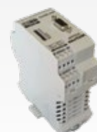
CAN MK 4I/4O