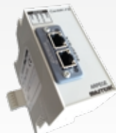
CAN MK FB