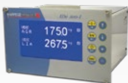
Indicateur IDé 500 I-B